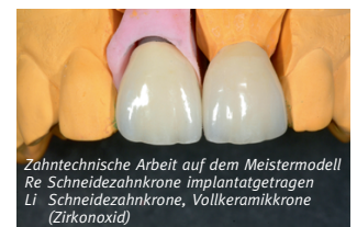
Zahntechnische Arbeit auf dem Meistermodell Re Schneidezahnkrone implantatgetragen Li Schneidezahnkrone, Vollkeramikkrone (Zirkonoxid)