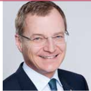
Mag. Thomas Stelzer Landeshauptmann

Überzeugen Sie sich bei der Langen Nacht der Forschung selbst davon, dass Oberösterreichs Forschung viel zu bieten hat.