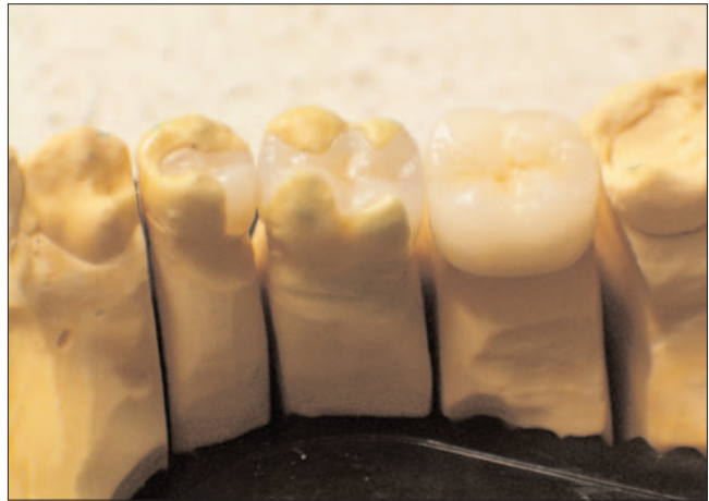
Abbildung von zwei gefertigten Keramik-Inlays sowie einer auf Zirkon aufgebrannten Vollkeramikkrone.

Die Herstellung im CAD/CAM, mit der alle biokompatiblen Materialien verarbeitet werden können, erhöht die Haltbarkeit, Qualität und Präzision des Zahnersatzes.